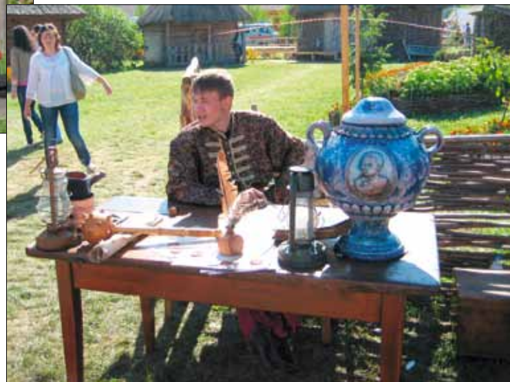
Грамоти на всі випадки життя!

Я прокинулася, налила кави, глянула на ранкове сонце і зрозуміла, що я щаслива. Невідомий автор