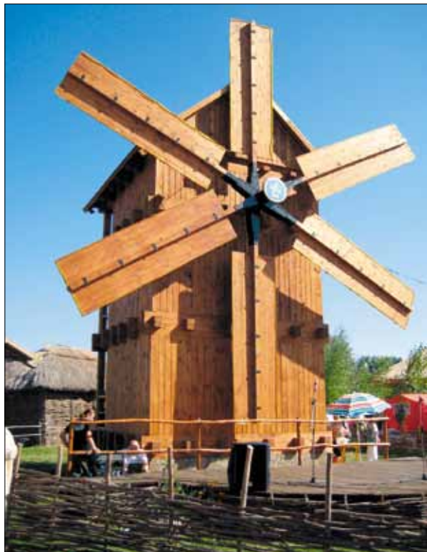
Млин, котрий у радіорубку перекваліфікували...