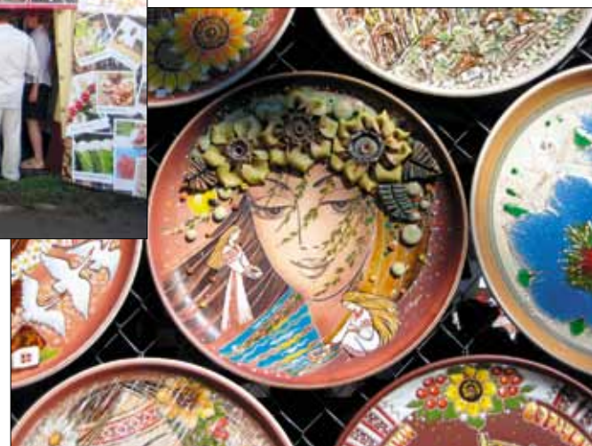
Краса української душі у витворах її митців