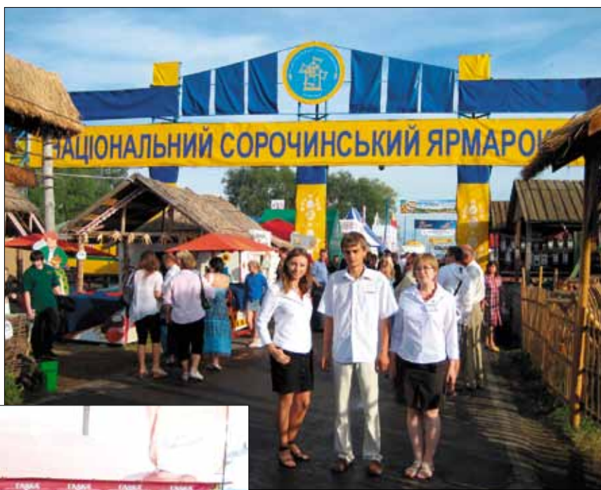
Центральний вхід на Ярмарок. Делегація від СП "Галка Лтд"

ському ярмарку, окрім Диплома учасника, цьогоріч отримала Грамоту за перемогу у номінації "За високоякісну смачну продукцію" Національного Сорочинського ярмарку-2011.