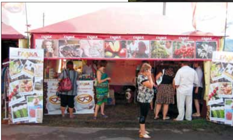
Найгарніший намет на Сорочинцях