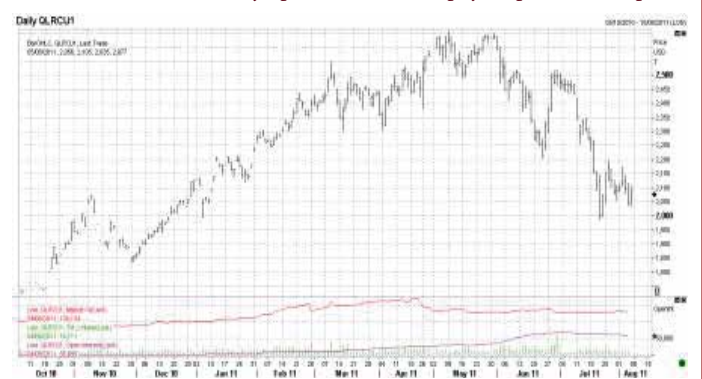
Динаміка цін на каву робусту в Лондоні (вересень 2011 р.)