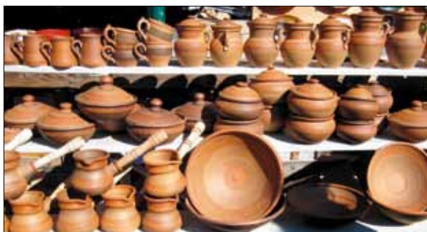
Посуд на усілякий смак