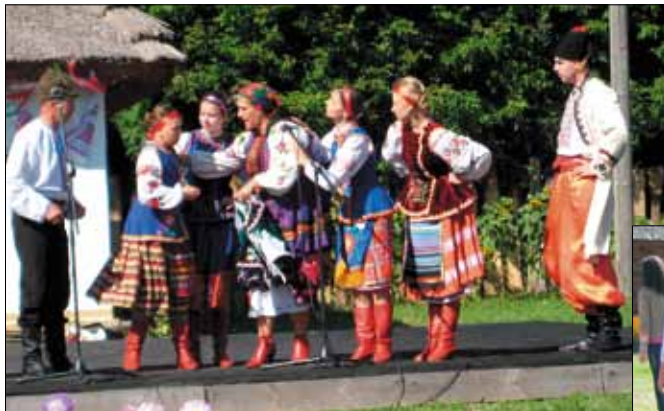
Кожушок не поділили